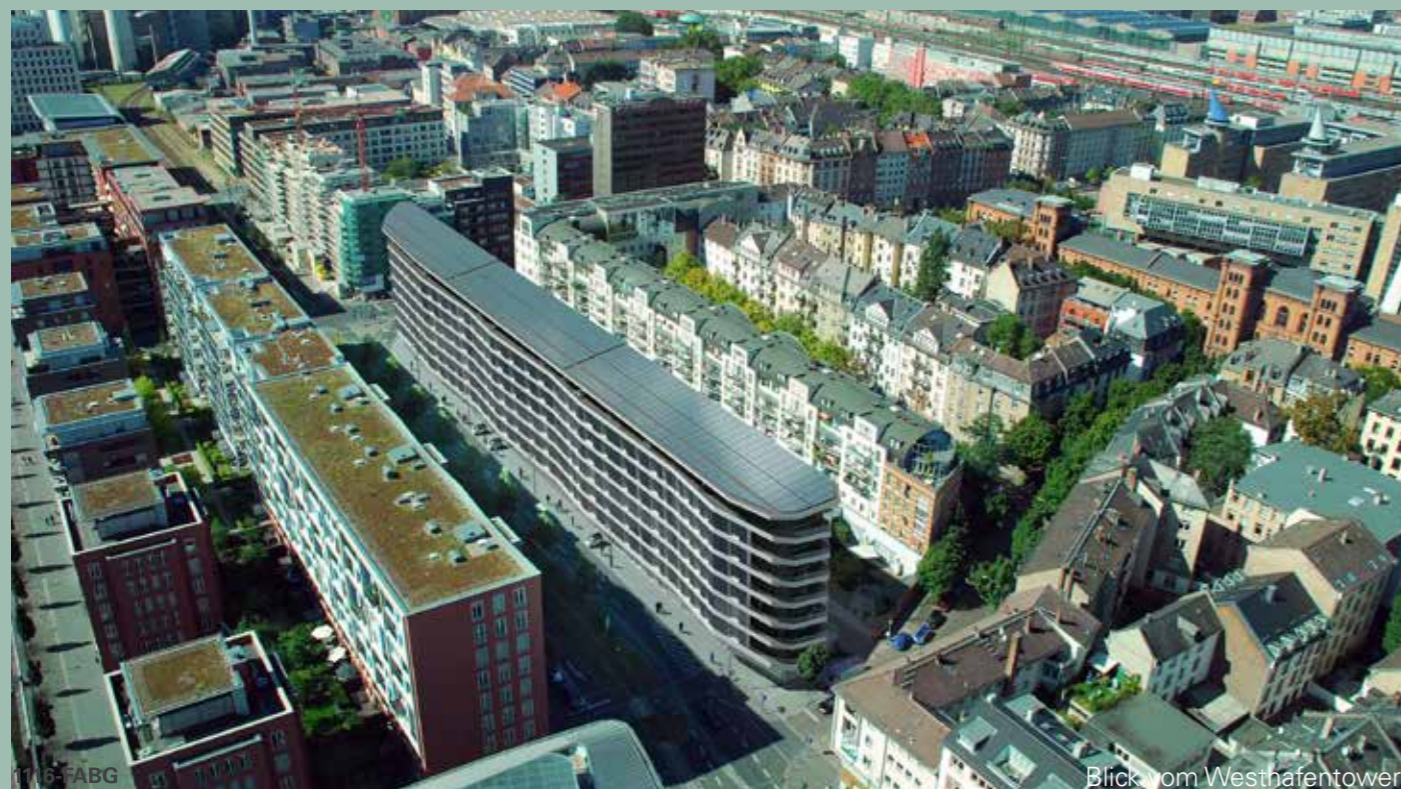
Blick vom Westhafentower