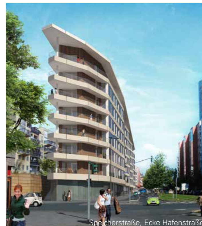
Speicherstraße, Ecke Hafenstraße